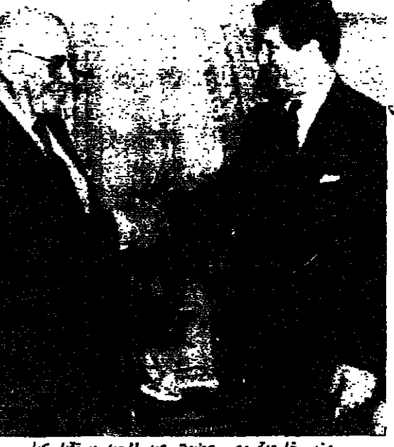
وزير خارجية مصر عصمت عبد المجيد يستقبل كيلي